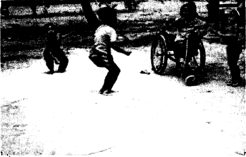
Fig. 3a. The children at play