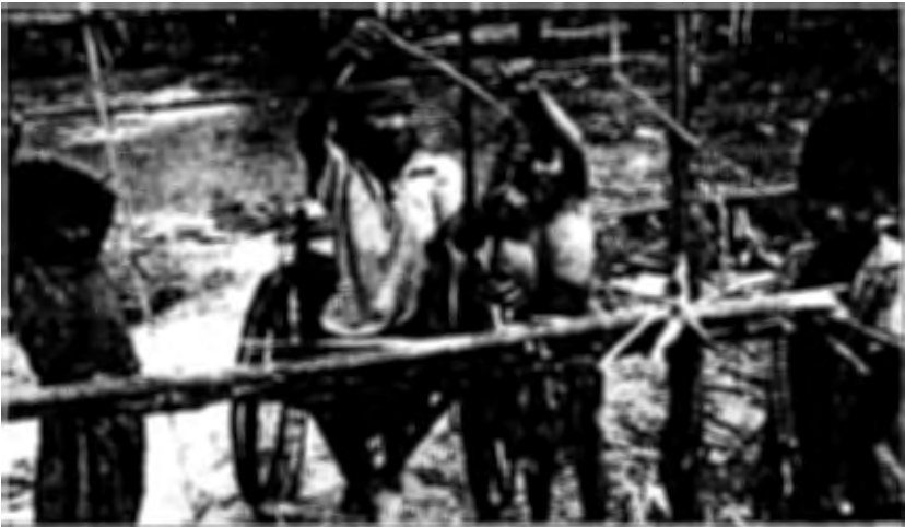
រូបទី ៣៨) កុមារជួយធ្វើកិច្ចការផ្ទះ