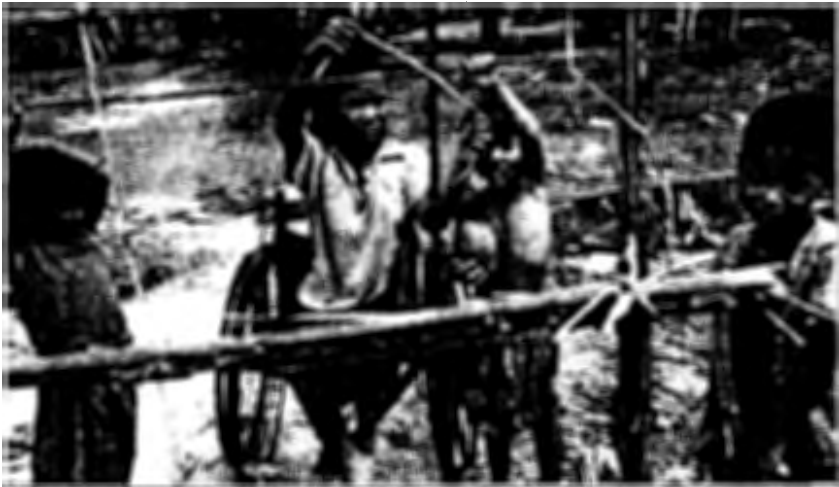
Fig. 3b. The children assist with household chores