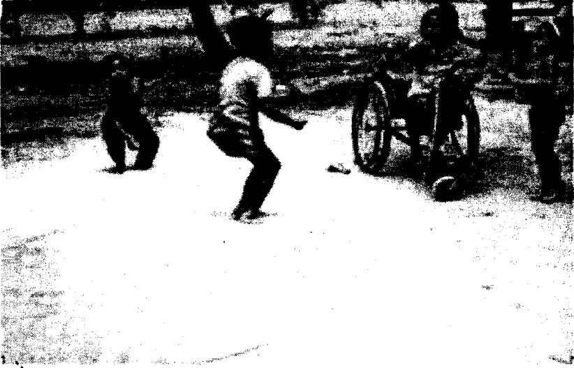
Fig. 3a. The children at play