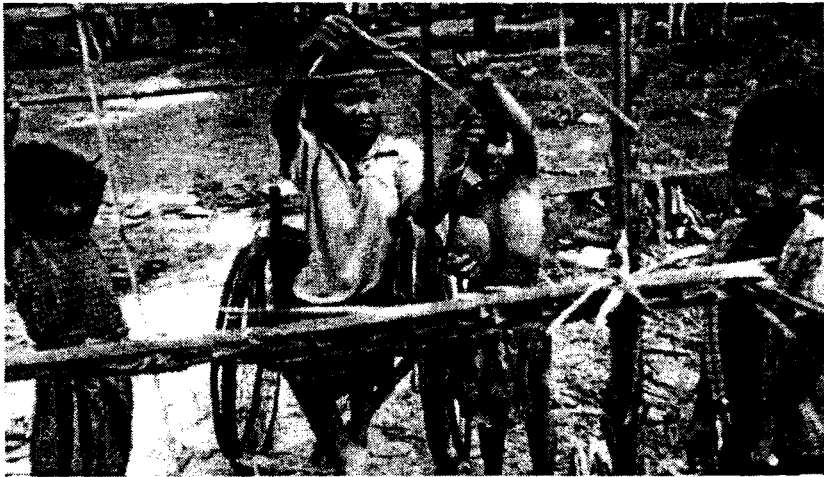
រូបទី ៣៨) កុមារជួយធ្វើកិច្ចការផ្ទះ