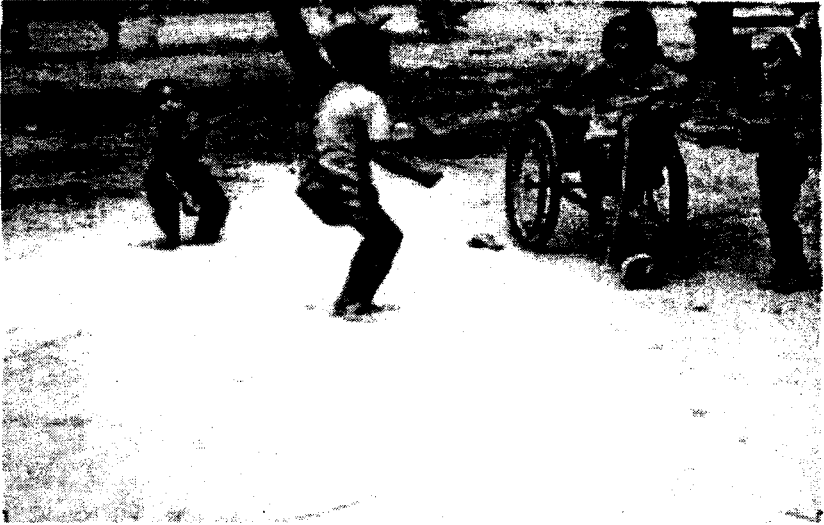
រូបទី ៣៧) កុមារកំពុងលេង